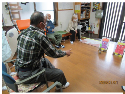
鬼を豆まきで退治！！