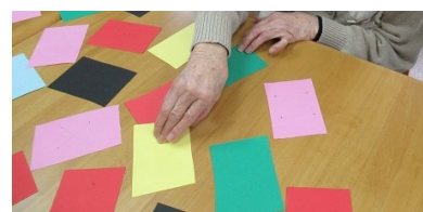
手作り神経衰弱をしています