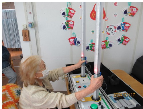
年一回の交通安全教室 ゲーム感覚で反射神経を調べました