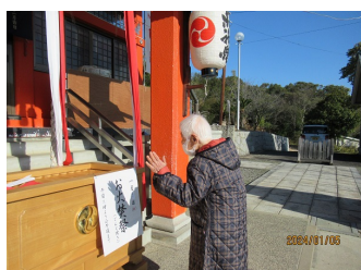
晴天のなか 大宮八幡宮へ初詣