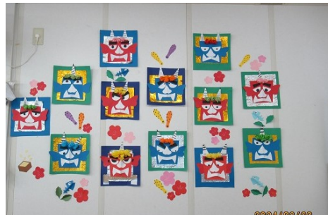
鬼の飾りを作りました それぞれ個性のある鬼が出来ました