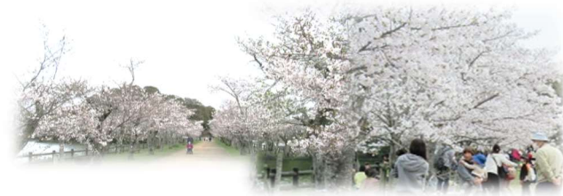
亀鶴公園へお花見に出かけました 桜の花は、やっぱりいいですね