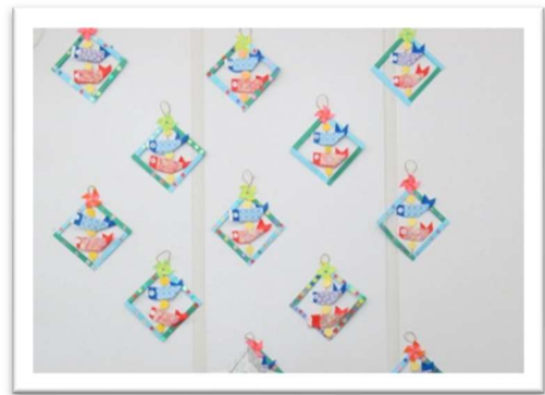
鯉のぼりの壁面飾り 思い思いに作りました