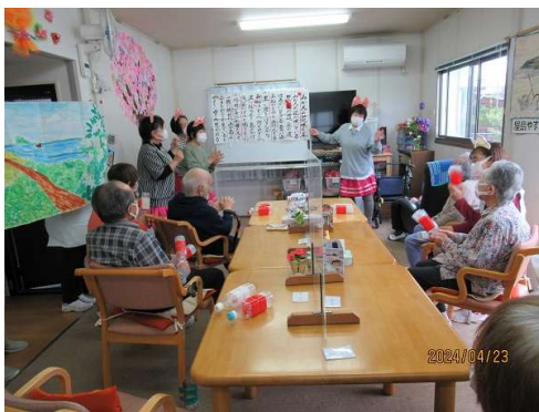
すみれ会 ボランティア 一曲終わるごとに ヤッター ヤッター イエーイ と、みんなで叫びました