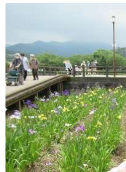
亀鶴公園 花菖蒲 見学に 出かけました

編集後記 コロナが5類へと移行し、活動も徐々に以前の状態に戻ってきました。しかし発症の噂は、まだまだ聞かれます。ご注意ください。田嶋美加枝