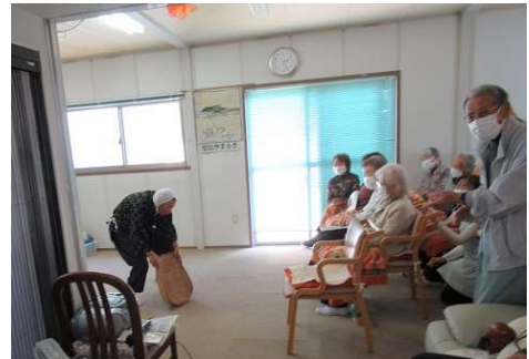
実里野会 ボランティア 歌に踊り ダンス