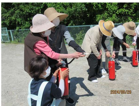
水消火器で 放水～ みんな体験しました